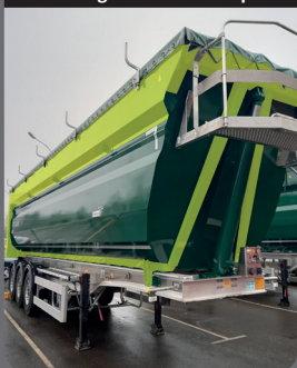
Ceinturage de caisse complet

Conception robuste grâce à un ceinturage complet de la caisse