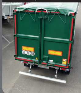
Porte 2 vantaux sans traverse supérieure

Porte 2 vantaux sans traverse qui offre une sécurisation du déchargement