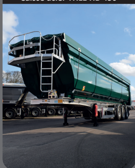
Caisse acier THLE HB 450

Haute résistance aux chocs et à l'abrasion grâce aux meilleurs alliages du marché