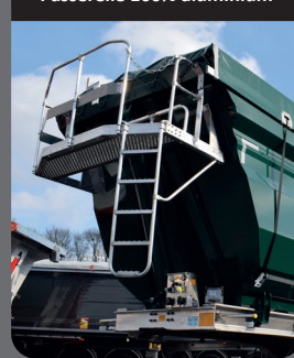
Passerelle 100% aluminium

Large passerelle sécurisée avec marche pied pour le contrôle du chargement.