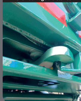
Déverrouillage à distance

Déverrouillage pneumatique à distance des crémones