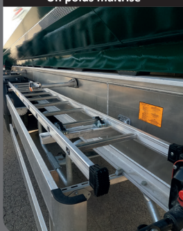
Un poids maîtrisé

Poids maîtrisé avec le châssis aluminium Made In BENALU !