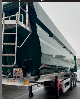
Tôles pliées longitudinalement

Rigidité remarquable préservant la charge utile