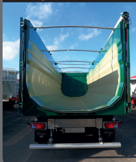
Déchargement sans obstacle

Déchargement sans aucun obstacle et en toute sécurité !