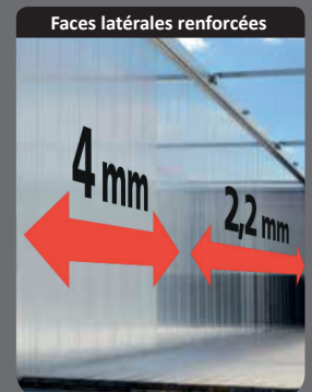
Faces latérales renforcées

Structure autoportante 100% aluminium qui offre une charge utile inégalée !