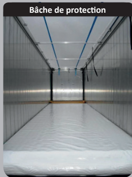
Bâche de protection

Cloison intérieure mobile renforcée (ép. 6mm) avec bâche renforcement