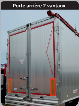
Porte arrière 2 vantaux

Porte double vantaux semi-encastrée (2 crémones). Soudures en continu et butoir transversal continu sur caisson pour la mise à quai