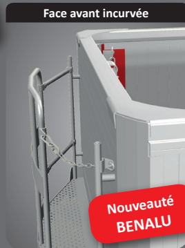
Face avant incurvée

Cloison incurvée unique sur le marché qui s'encastre dans la face avant et qui permet le compactage avec cloison. Solution brevetée BENALU