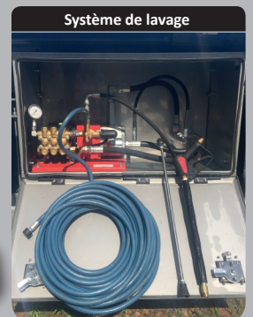
Système de lavage

Lavage embarqué basse pression ou haute pression (150bars)