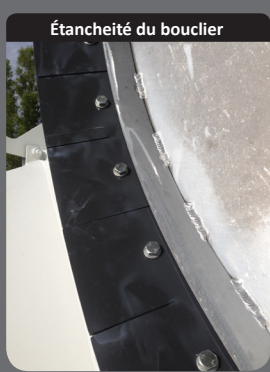
Étanchéité du bouclier

Bouclier CITEF breveté semi-sphérique en aluminium