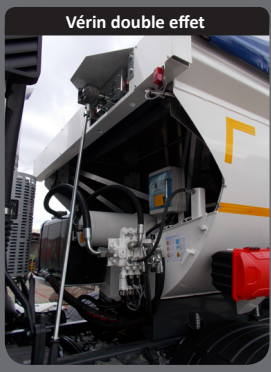
Vérin double effet

Becquet amovible qui permet d'optimiser la retombée des enrobés dans le finisher