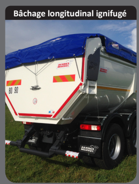
Bâchage longitudinal ignifugé

Vérin télescopique double effet. Pression de service 170 bars maxi