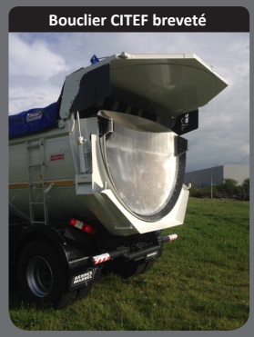
Bouclier CITEF breveté

Porte hydraulique double effet relevable par un double vérin