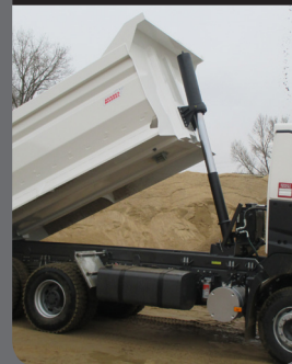
Basculement vérin frontal

Basculement par vérin frontal qui assure puissance de levage, stabilité au bennage, angle et temps de bennage améliorés