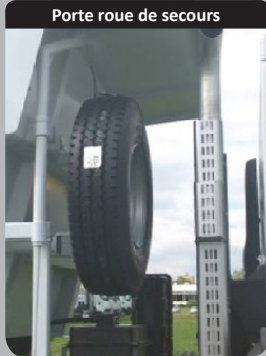
Porte roue de secours

Porte roue disposé sur la face avant qui s'incruste parfaitement dans l'ensemble.