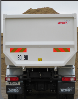
Porte hayon monobloc

Porte arrière monobloc à hayon oscillant haut avec déverrouillage automatique et double articulation