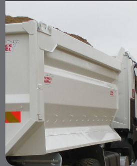
Facès latérales renforcées

Ridelles pliées, nervurées avec formes arrondies en acier HLE & THLE bord supérieur - Ridelles type brise roche