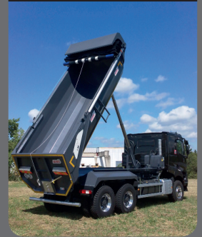
Vérin grand angle

Porte arrière inclinée à 25° à relevage hydraulique avec trappe de visite pour une maintenance aisée