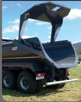
Ouverture de porte

Ouverture de porte à 95° offrant un dégagement total lors du déchargement