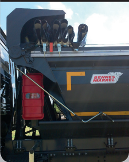
Protection de bâche

Capot de protection de bâche aluminium adapté aux risques du BTP.