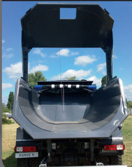
Caisse acier HB500

Caisse à facettes acier THLE HB500 réalisée en une seule soudure longitudinale